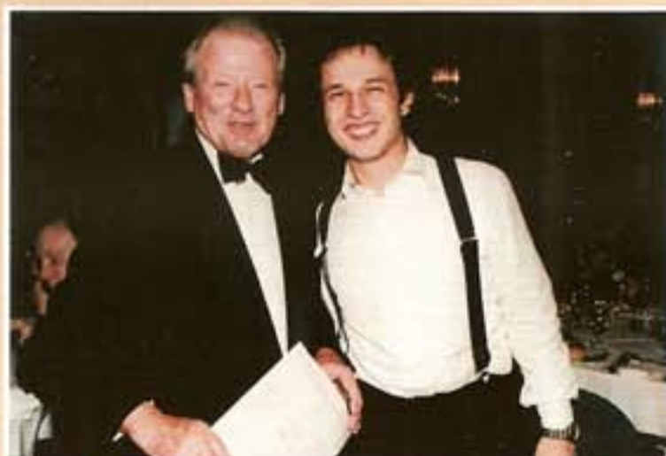
Con Sir Neville Marriner