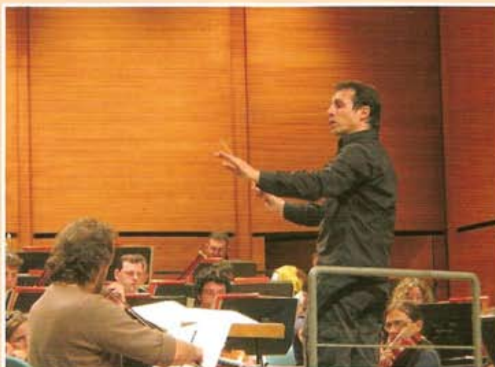
Orchestra Verdi - Auditorium Milano