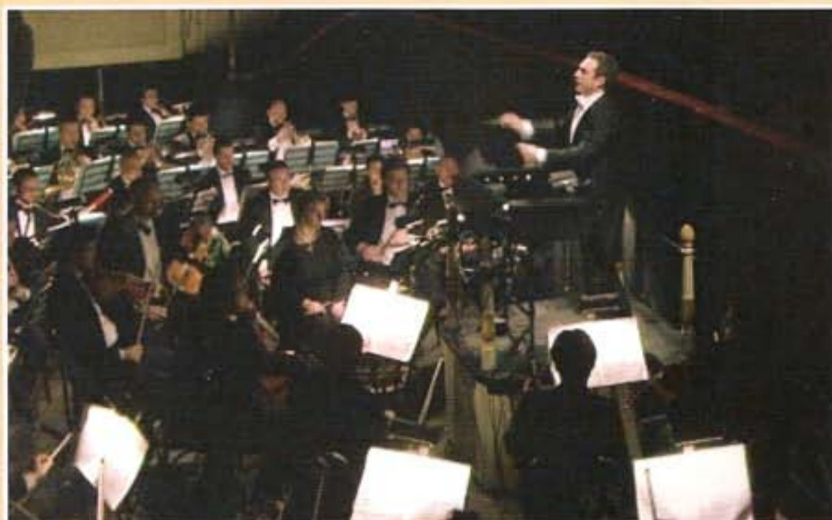
"Otello" - Ravenna 2007